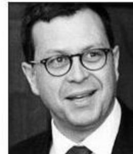
El ministro del Interior, Rodrigo Hinzpeter.

En la UDI recuerdan que la coordinación de la mesa de Coloma con el gabinete tuvo su primera instancia cuando la Alianza llevaba menos de 20 días en La Moneda. Hasta el partido llegaron, el 29 de marzo, el titular de la Segpres, Cristián Larroulet, y el ministro de Mideplan, Felipe Kast. En la ocasión, los temas tratados fueron la emergencia postterremoto y la instalación de las nuevas autoridades.