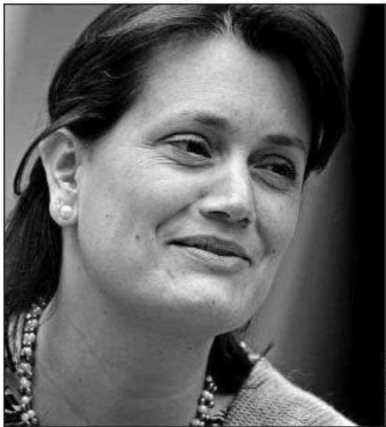
La ex ministra de Bachelet, Laura Albornoz (DC).